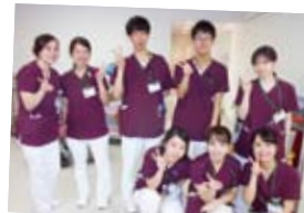
同期との集合写真。故郷も出身校もバラバラだけど、入職してすぐに意気投合！プライベートでも仲良しです♪